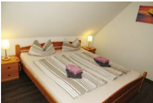
Separates Eltern-Schlafzimmer mit Doppelbett und Kleiderschrank