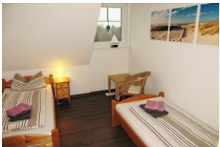
Separates Kinderzimmer mit zwei Einzelbetten, einem Rattansessel...