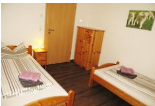
...und mit einer Wäschekommode.