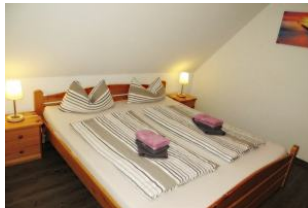
Separates Eltern-Schlafzimmer mit Doppelbett und Kleiderschrank