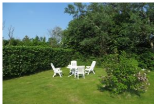
Grillmöglichkeit im Garten