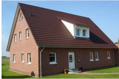
Neues Einfamilienhaus in ruhiger Lage (Strandnähe: 100 m)