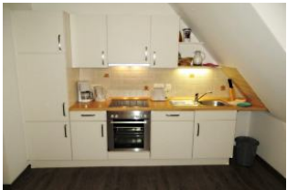
Integrierte Küchenzeile: komplett ausgestattet (Töpfe, Geschirr, Besteck, Kaffeemaschine, Toaster, Wasserkocher, Mixer, Eierkocher etc.)