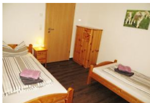
...und mit einer Wäschekommode.