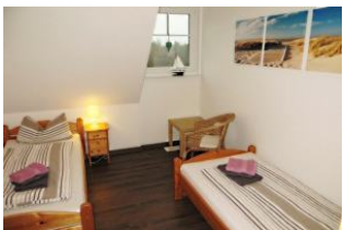
Separates Kinderzimmer mit zwei Einzelbetten, einem Rattansessel...