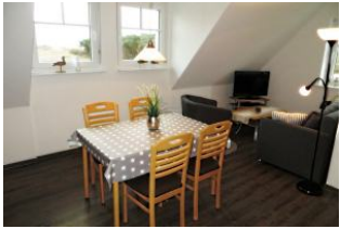
Wohnraum mit Esstisch, dahinter ein traumhafter Blick in die grüne Natur, auf das Meer und zur Nachbarinsel Amrum