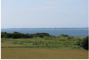
Herrlicher Ausblick in die grüne Natur und zur Nordsee!