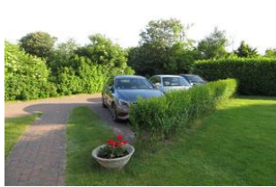
PKW-Stellplätze auf dem Privatgrundstück vor dem Haus