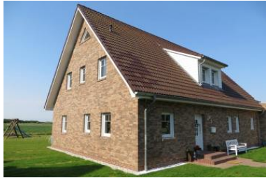
Einfamilienhaus in Strandnähe (100 m)