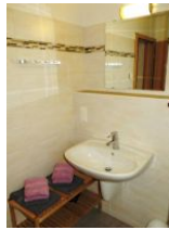
Badezimmer mit Ablageflächen und Waschbecken...