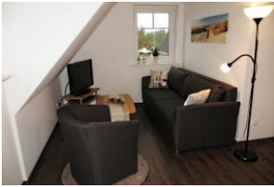
Gemütliche Sitzzecke mit Sofa, Sessel, Sat.-TV, DSL-Internet, Telefon, Radio