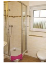
...sowie mit Dusche und WC.