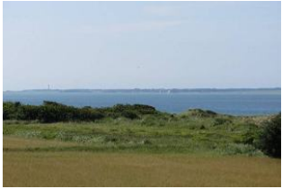
Herrlicher Ausblick in die grüne Natur und zur Nordsee!