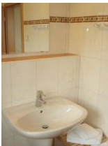
...sowie mit Waschbecken und Abflageflächen.