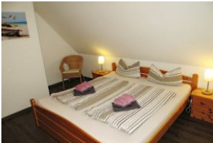
Separates Schlafzimmer mit Doppelbett, Kleiderschrank, Wäschekommode und Rattansessel