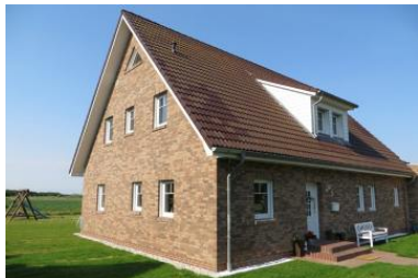
Einfamilienhaus in Strandnähe (100 m)