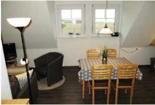
Wohnraum mit Esstisch, dahinter ein traumhafter Blick in die grüne Natur, auf das Meer und zur Nachbarinsel Amrum