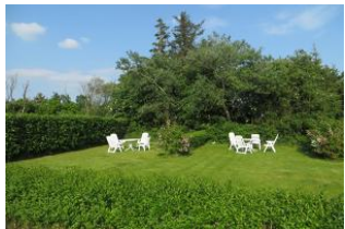
Großer grüner Garten mit Sitz-/ Liegemöbeln vor dem Haus

Die neue Ferienwohnung ist stilvoll eingerichtet, wirkt hell + freundlich durch viel natürliches Licht und bietet bei Komfort im gehobenen Segment eine entspannende Atmosphäre für 1 bis 3 Personen. Ein Sat.-Farbfernseher, Radio und Telefon sowie ein optionaler DSL-Internetanschluß (LAN + WLAN) dienen der Unterhaltung. Im separaten Schlafzimmer erwarten Sie ein Doppelbett mit sehr guten Matratzen, ein Rattansessel, ein geräumiger Kleiderschrank sowie eine Wäschekommode. Bettwäsche wird zur Verfügung gestellt, ebenso Hand-, Dusch- und Küchentücher. Die Zudecken und Kopfkissen aller Betten sind aus Synthetik (Allergiker-gerecht). Das Badezimmer mit Fenster ist mit einer Toilette und Dusche ausgestattet (Föhn vorhanden). Erleben Sie ein optimales Wärmeverteilungsprofil durch die ganzflächig installierte Fußbodenheizung. Jedes Zimmer ist bei Bedarf separat temperierbar. Ein schöner Urlaub ist vorprogrammiert.