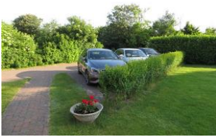
PKW-Stellplätze auf dem Privatgrundstück vor dem Haus