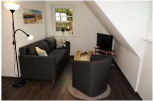
Gemütliche Sitzecke mit Schlafsofa, Sessel, Sat.-TV, DSL-Internet, Telefon, Radio