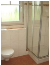
Badezimmer mit WC und Dusche...