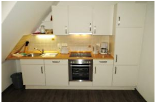
Integrierte Küchenzeile: komplett ausgestattet (Töpfe, Geschirr, Besteck, Kaffeemaschine, Toaster, Wasserkocher, Mixer, Eierkocher etc.)